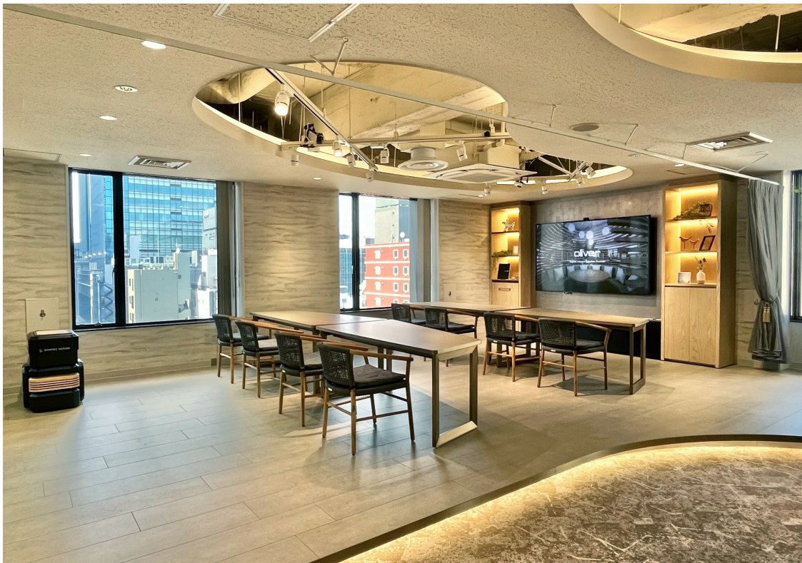
ロボットがレイアウトを変更するミーティングスペース

デジタルテックを取り入れることで、より人間らしく働きやすいオフィスを実現しました。