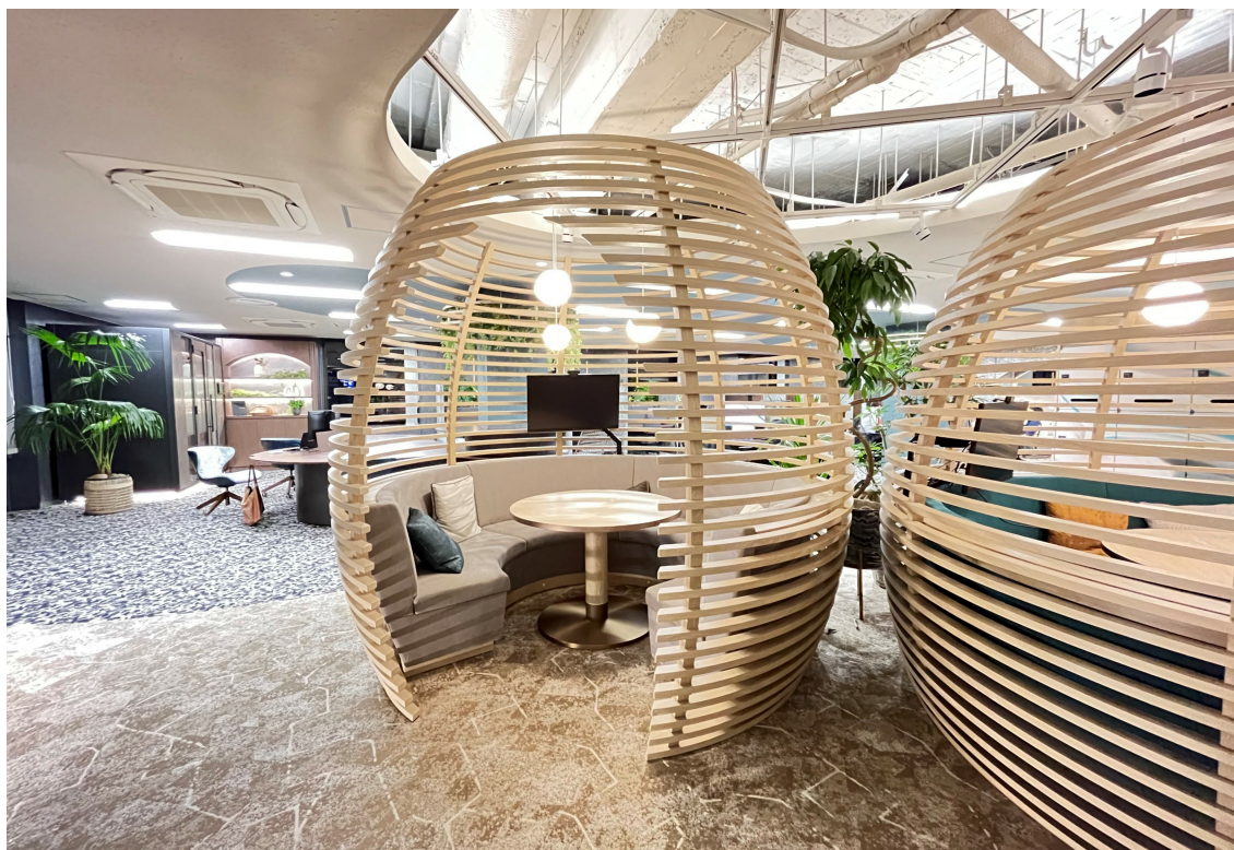
FSC®認証材を用いたウッドルーバーのミーティングポッド

オリバー東京日本橋オフィスでは、高いデザイン性だけでなく、環境へ配慮した素材を家具や内装材の随所に活用しています。