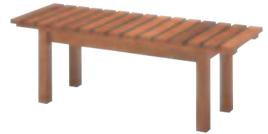
SSW-78・BR ブラウン W120 ¥41,790 (¥39,800) W1,200・D420・H420