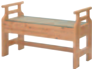
SSW-82・A・H 肘付 W103 ¥72,975 (¥69,500) W1,030・D480・H650・SH450・400