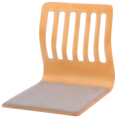
SCZ-202・N ナチュラル ¥9,240 (¥8,800) W410・D530・H430 張材:平織布