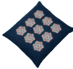
SCB-001・A ブルー ¥5,145 (¥4,900) W550・D590・t90 カバー:綿100% 中身:わた1.0kg