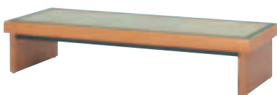
SSW-810・B 背無ベンチ ¥109,200 (¥104,000) W1,830・D635・H385