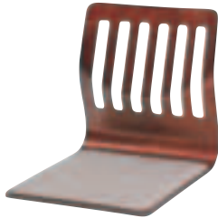
SCZ-202・K ケヤキ ¥9,240 (¥8,800) W410・D530・H430 張材:平織布