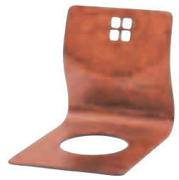
SCZ-1710・K ケヤキ ¥7,140 (¥6,800) W400・D520・H415・t9