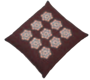
SCB-001・B エンジ ¥5,145 (¥4,900) W550・D590・t90 カバー:綿100% 中身:わた1.0kg