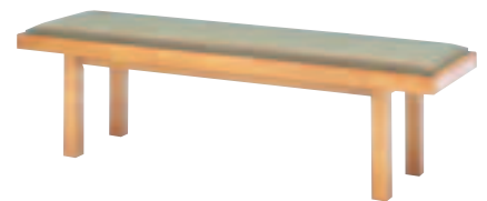
SSW-87・N2・A ¥55,125 (¥52,500) W1,500・D420・H430

主材:ラバーウッド・ウレタン塗装・強化紙貼・MDF脚 張材:ニット布(裏面防水フィルム) 座面:畳