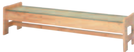
SSW-82・B・H 肘付 W206 ¥94,500 (¥90,000) W2,060・D480・H650・SH450・460