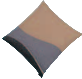
SCB-015・B ベージュ ¥11,235 (¥10,700) W540・D580・t100 カバー:綿100% 中身:わた1.0kg