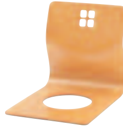
SCZ-1710・N ナチュラル ¥7,140 (¥6,800) W400・D520・H415・t9