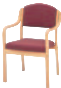
SCW-2130・N・AC ¥41,160 (¥39,200) 張材：平織布 CF-01F ]