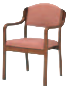
SCW-2130・L・AC ¥44,100 (¥42,000) 張材：ジャガード布 [EF-05C ]