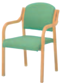
SCW-5400・N2・AC ¥34,650 (¥33,000) 張材:平織布[CF-03C]