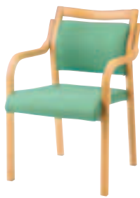
SCW-5510・N2・AC ¥38,010 (¥36,200) 張材:平織布[CF-03C]