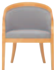
SCW-3850・N3 アームチェア ¥78,540 (¥74,800) 張材: 再生平織布 CF-04A ]