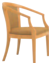
SCW-3851・N3 アームチェア ¥71,400 (¥68,000) 張材: ジャガード布 DF-15B ]